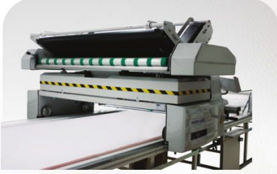
Cradle Feed sayesinde zor kumaşlar bile tansiyonsuz serim imkanı Cradle Feed System Provides Tension-Free Spreading