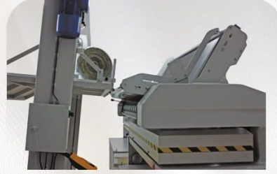
ML1 Kumaş Yükleme Vinci ML1 Fabric Lifting Device