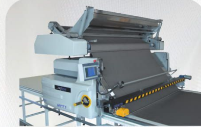
Otomatik Kesim Aparatı Automatic Cutting Device