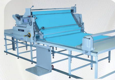
Zikzak Aparatı Zigzag Equipment