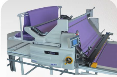
Sallama Aparatı - Otomatik Kesim Aparatı Flat Fold Attachment - Automatic Cutting Device