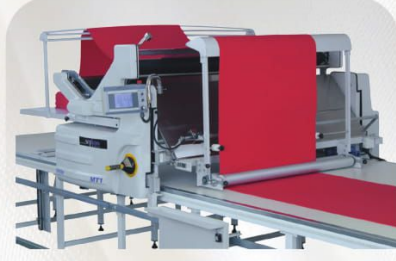
Tüp Serim Aparatı Tubular Unit