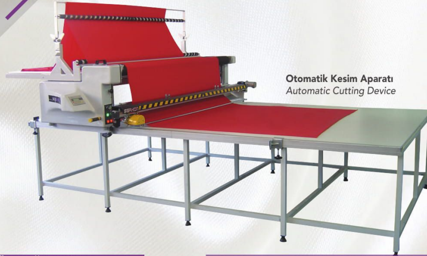
Otomatik Kesim Aparatı Automatic Cutting Device

Sadece bir personel ile hızlı ve ekonomik serim, serim esnasında isteğe göre zikzak veya tek yön serim elektronik debriyaj sistemi ile kolay kullanım serilen her katın ekranda sayımı fotosel kontrolü ile düzgün bir yan duvar oluşumu.