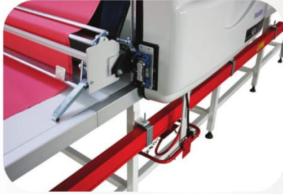
Zikzak Aparatı Zigzag Equipment

Tam Otomatik Döner Kafa Kumaş Serim Makinası Fully Automatic Turn Table Fabric Spreading Machine