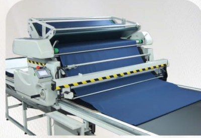
Otomatik Kesim Aparatı Automatic Cutting Device