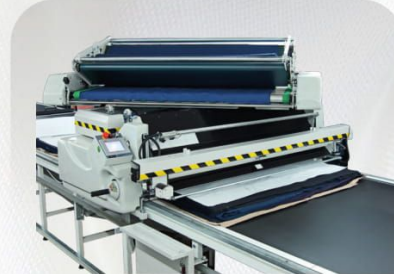
Döner Kafa Turn Table