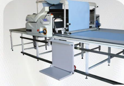
Tüp Aparatı Tubular Unit