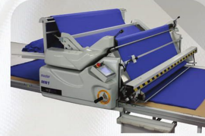
Sallama Aparatı Flat Fold Attachment