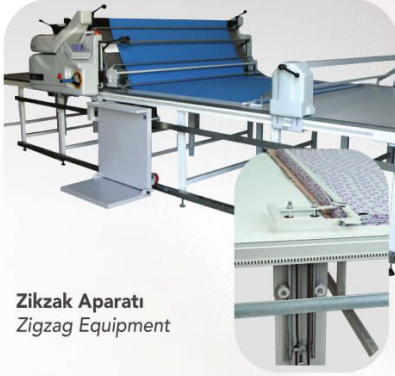
Zigzag Aparatı Zigzag Equipment