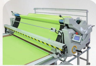
Otomatik Kesim Aparatı Automatic Cutting Device