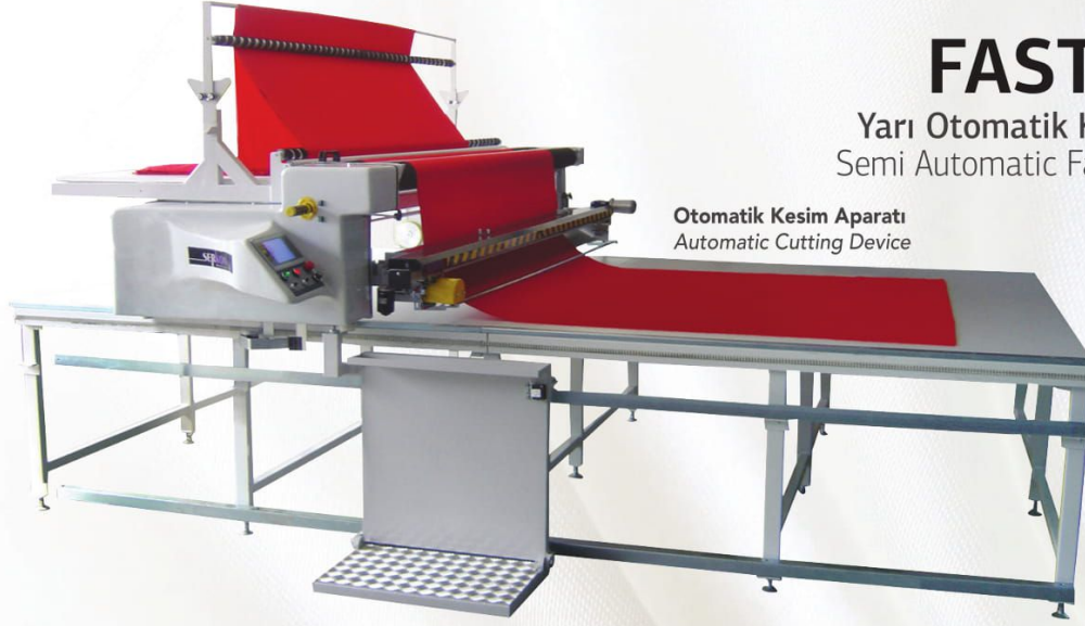
Otomatik Kesim Aparatı Automatic Cutting Device